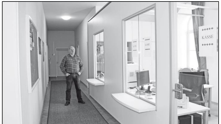
Die „Kasse“ in den neuen Räumen im OG.