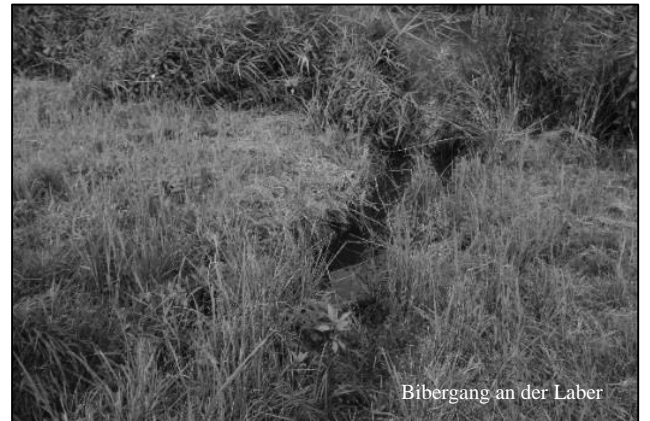
Bibergang an der Laber