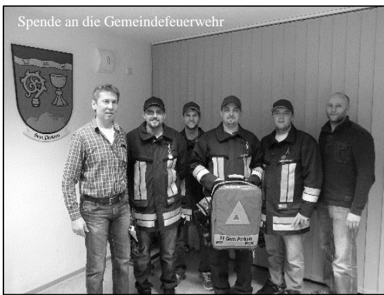
Spende an die Gemeindefeuerwehr