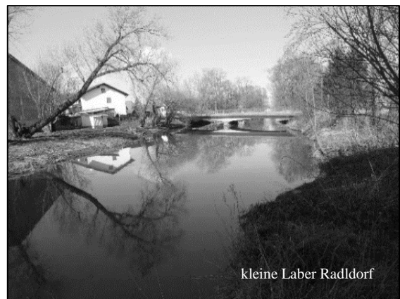
kleine Laber Radldorf