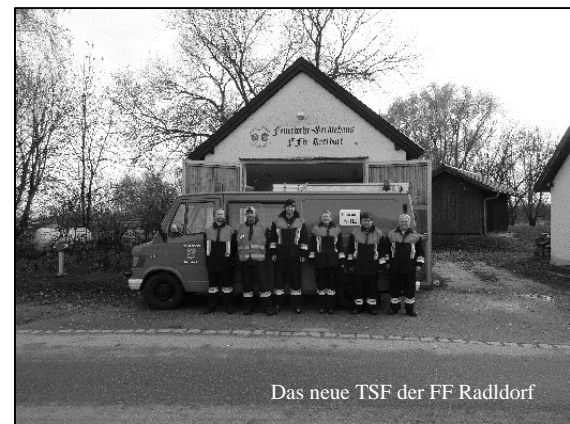
Das neue TSF der FF Radldorf