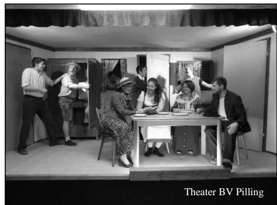
Theater BV Pilling