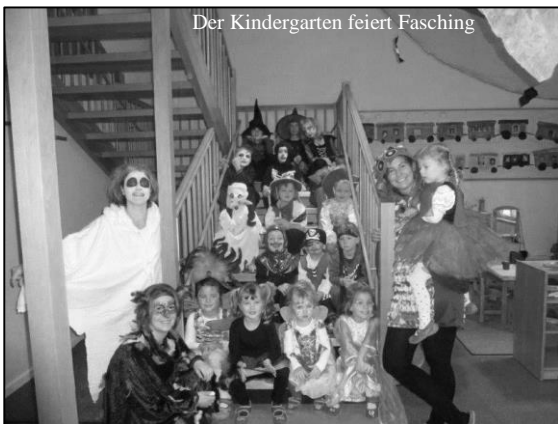
Der Kindergarten feiert Fasching