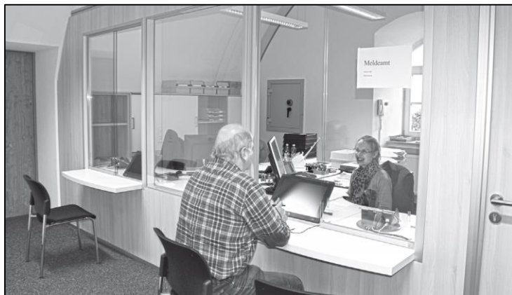
Modern, hell und ansprechend präsentiert sich das neue Pass- und Meldeamt im EG.