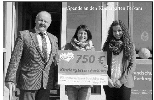
Spende an den Kindergarten Perkam