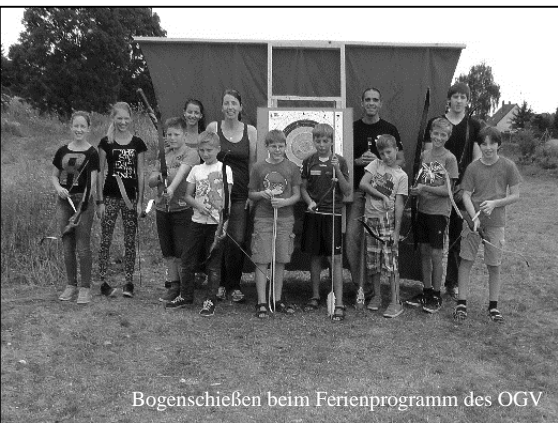
Bogenschießen beim Ferienprogramm des OGV