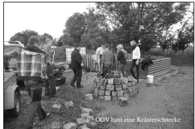
OGV baut eine Kräuterschnecke