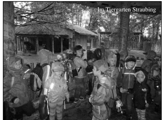
Im Tiergarten Straubing