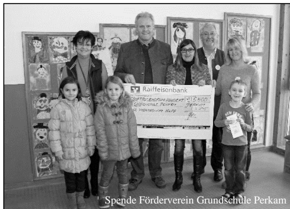
Spende Förderverein Grundschule Perkam