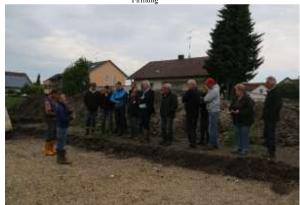
Gemeinderat im Baugebiet Straubinger Straße