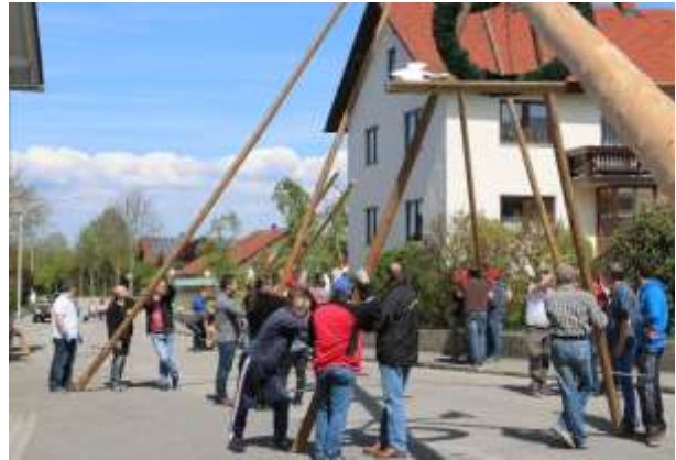
Maibaumaufstellen FFW Perkam