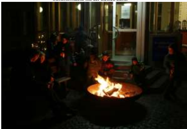
Adventsmarkt der Grundschule Perkam