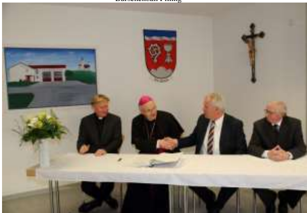
Eintragung ins Goldene Buch Bischof Dr. Voderholzer