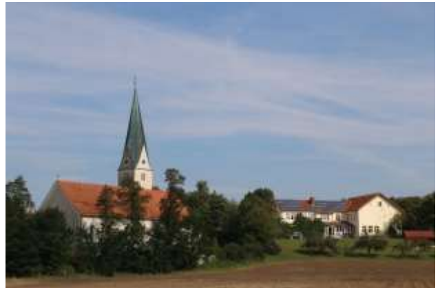
Kirche und Grundschule