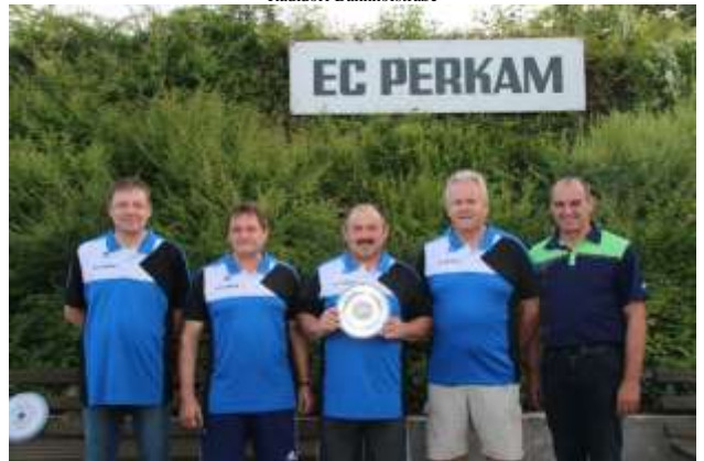
EC Perkam Aufstieg