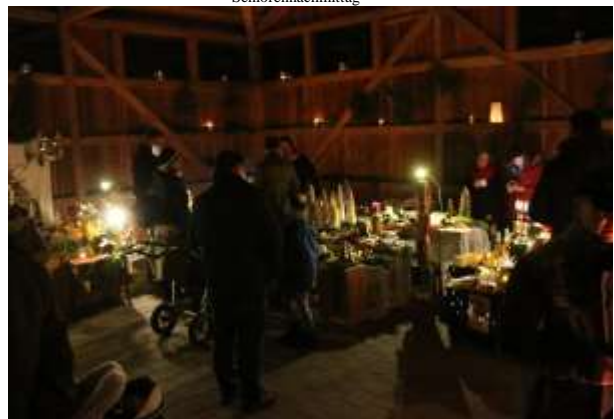
Adventsmarkt der Grundschule Perkam