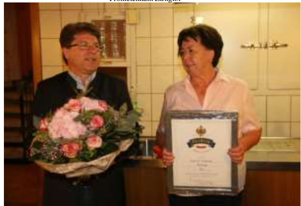
Geschäftsjubiläum Gasthaus Sommer