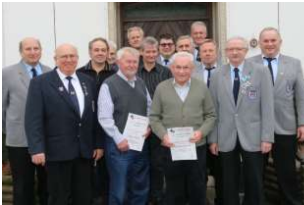
KSK Pilling-Radldorf Ehrungen