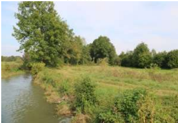
Ökotothfläche mit der kleinen Laber