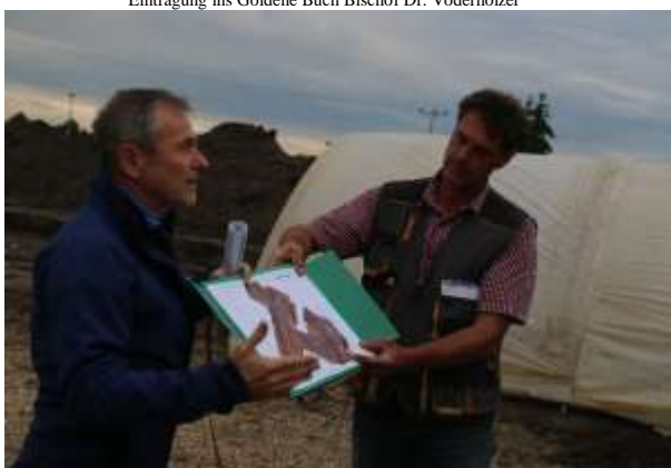
Archäologische Grabungen Baugebiet Straubinger Straße