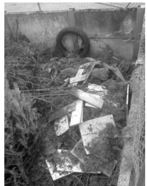
Fehlerhafte Einwürfe im Grüngut wie z.B. Eisen- oder Betonteile verursachen immer wieder gewaltige Schäden an den Maschinen, die in der Verarbeitung des Materials eingesetzt werden.

Im Kompostwerk Aiterhofen werden die organischen Abfälle aus den Haushalten des gesamten Verbandsgebietes kompostiert. Diese erreichen beträchtliche Jahresmengen von etwa 22.000 t bei Grüngut und ca. 13.000 t bei Bioabfällen. Ganz im Sinne der Gebührenzahler achtet der ZAW-SR auf eine umweltfreundliche wie auch wirtschaftliche Verwertung der Abfälle. Holziger Baum- und Strauchschnitt konnte die letzten Jahre als Heizmaterial abgesetzt werden. Im Moment steht allerdings dieser Markt aufgrund der milden Winter, des großen Angebotes an Käferholz sowie der niedrigen Ölpreise nicht für das Grüngutmaterial des ZAW-SR zur Verfügung. Damit ist das Kompostwerk komplett mit der Lagerung und Verarbeitung der anfallenden Abfälle ausgelastet. Umso mehr muss darauf geachtet werden, dass keine Übermengen oder Mengen aus unzulässigem Herkunftsbereich angeliefert werden. Der ZAW-SR bittet um Verständnis, wenn die Wertstoffhofbetreuer die Richtlinien etwas weniger großzügig umsetzen wie in der Vergangenheit.