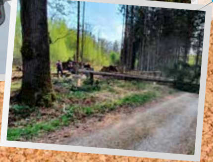
Aufstellen Container Heizzentrale Rain Mitte