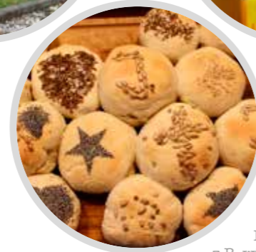
ERNÄHRUNG z.B. wir mahlen Mehl mit unserer Getreidemühle und backen Vollkornsemmeln