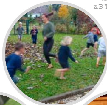
WASSER z.B. Taulaufen