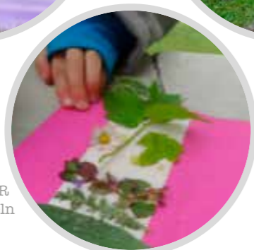
HEILKRÄUTER z.B. wir sammeln Wildkräuter