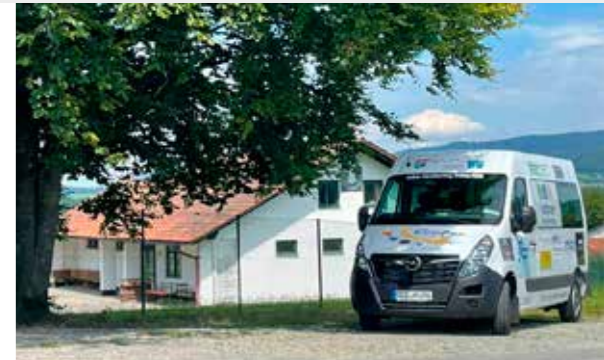
So soll der neue CarSharing Bus für die VG Rain aussehen. (Beispielbild: CarSharing Fahrzeug Standort Mitterfels)

Die Verwaltungsgemeinschaft Rain möchte ihren Bürger:innen dieses Angebot so bald wie möglich zur Verfügung stellen. Insofern sich genügend Unterstützer:innen und Sponsor:innen finden, die das Fahrzeug, durch Platzierung ihrer Werbeflächen, auf die Straße bringen. Der geräumiger Neunsitzer soll gut sichtbar und zentral vor dem Rathaus stehen, wo er für Fahrten allerlei Art gegen eine günstige Nutzungsgebühr (Tagesgebühr: 44,90 €, Stunde: 4,90 €, pro Buchung 300 km inklusive, jeder weitere km kostet 0,11 €, keine Kautions) ausgeliehen werden kann. Mit diesem Fahrzeug werden die Grenzen des üblichen Führerscheins der Klasse B im privaten Rahmen optimal ausgeschöpft: Egal ob Vereins- oder Familienfahrten, oder die gemeinsame Fahrt ins Stadion; schon bei der Fahrt sind alle zusammen und der Rathausparkplatz bietet mit den zahlreichen Parkplätzen und der zentralen Lage einen guten Treffpunkt zur Ab- oder Weiterfahrt. Das könnte auch ortsansässige Firmen interessieren, denn auch als kurzfristige Fuhrparkergänzung oder als Mitarbeiterfahrzeug bzw. für den Transport von Auszubildenden kann der Wagen eingesetzt werden. Den stets einsatzbereiten Zustand, inklusive Versicherung, Instandhaltung, Reparaturen und Inspektion, sowie die Reinigung gewährleistet mikar.