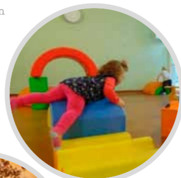
BEWEGUNG wöchentlich in der Turnhalle, täglich im Garten