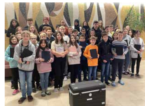
Die Klassen Jami 5/6 und M 8 nehmen am Schulversuch „Digitale Schule der Zukunft“ teil.

Im Oktober wurden auch die beiden Computerräume des Schulgebäudes in Rain sowie die Klassenzimmer im Schulhaus Aholing mit neuen Widescreens ausgestattet. Im Rahmen einer schulinternen Lehrerfortbildung informierten sich auch die Vertreter des Sachaufwandsträgers über die neue Ausstattung.