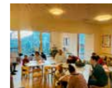
Beispiel Gruppenraum unten