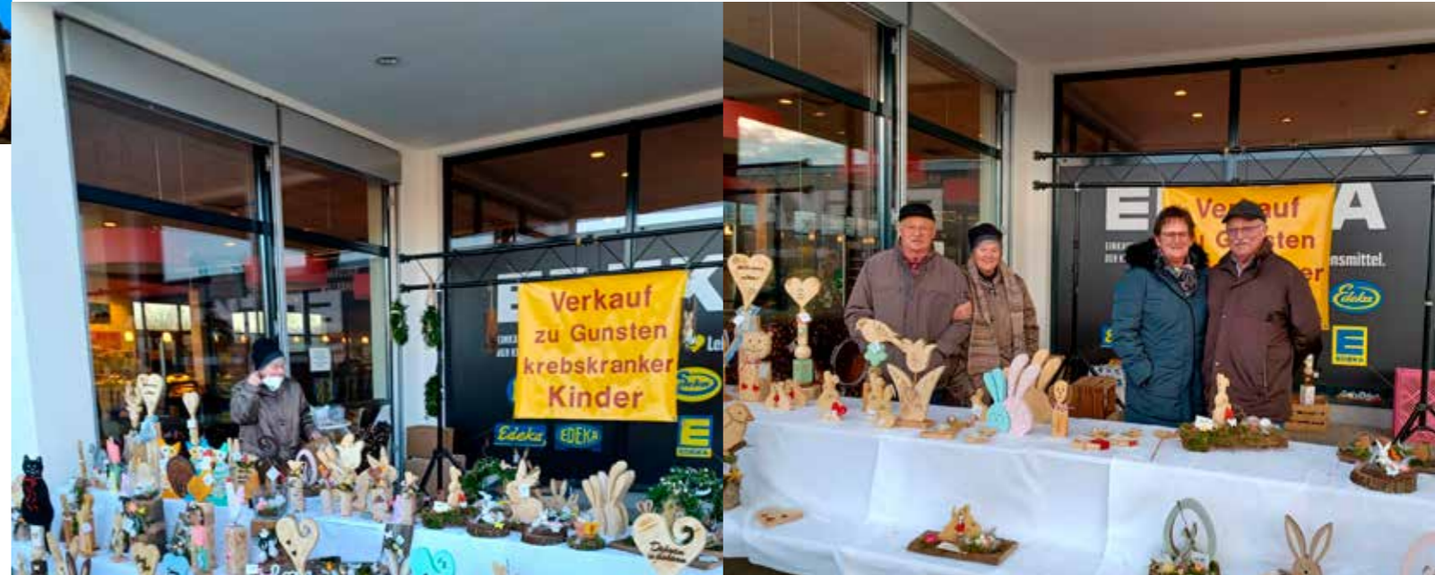
vorher - - - nachher

Am 4. und 5. März durfte die Gruppe „Helfende Hände“ aus Rain und Mallersdorf-Pfaffenberg bei Bäckerei Ettl und Edeka Berger einen großen Verkaufsstand für ihre Bastelsachen aufstellen.