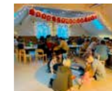
Beispiel Gruppenraum oben

Weitere Räumlichkeiten und unseren neu gestalteten Garten mit Tunnelrutsche, neuer Fahrzeugstrecke und weiteren Spielmöglichkeiten, können Sie am Samstag, den 06.05.2022 am „Tag der offenen Tür“ unserer Einrichtung besichtigen. Wir freuen uns auf Sie.