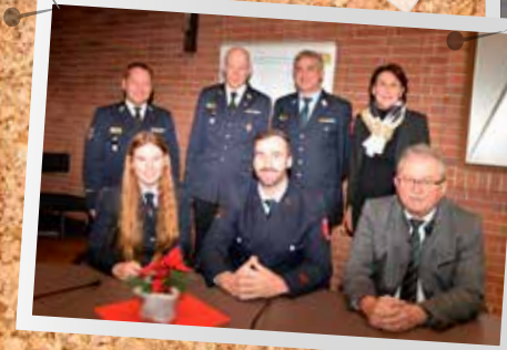
Übergabe Bayerischen Ehrenamtskarten am 07.12.2022