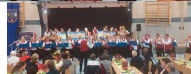
Gemeinschaftschor bei der Feierstunde

Den Schlusspunkt der Feierlichkeiten bildete das gemeinsame Musizieren der Bläserfreunde Rain e.V., der Stadtkapelle Geiselhöring und der Blaskapelle Brasseria mit „Böhmischer Traum“, dem „Deutschmeister Regimentsmarsch“, „Dem Land Tirol die Treue“, der „Fuchsgraben Polka“ und der „Bayernhymne“.