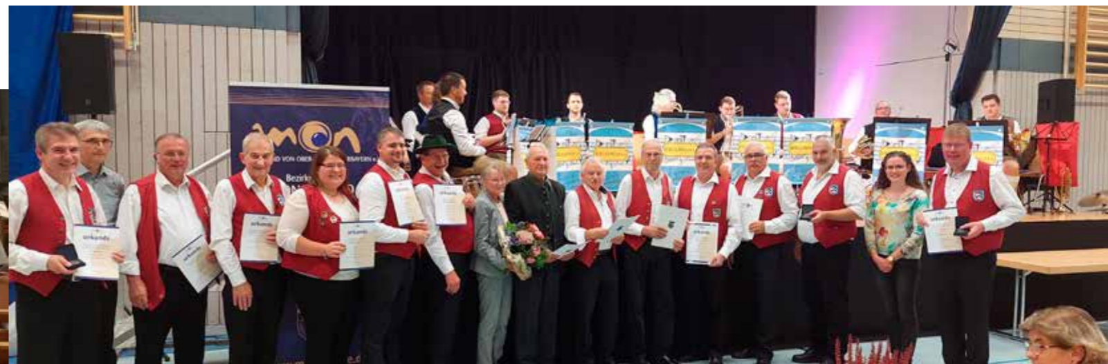
Ehrungen von Musiker*innen