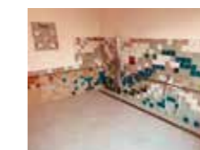
Kneippraum für Wasseranwendungen