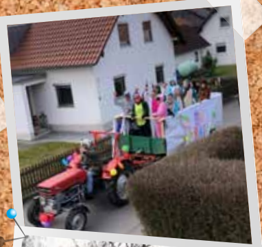
Faschingsumzug des Oldtimerverein Wiesendorf 2022