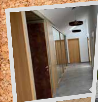
Bürgerhaus in Dürnhart

Wenn Sie gerne Ihre eigenen Schnappschüsse aus der Gemeinde veröffentlichen wollen, dann senden Sie uns diese per e-Mail zu!