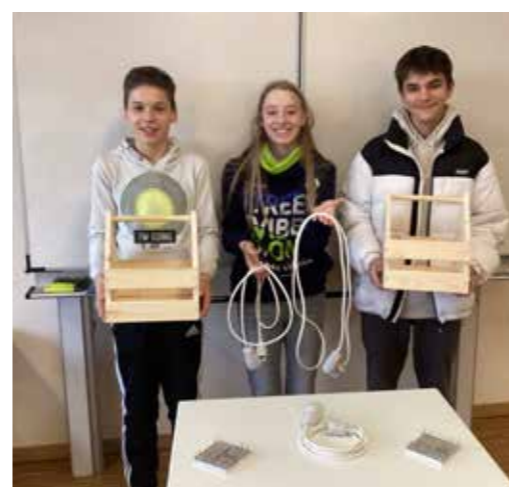
Berufsorientierungswoche – Schüler zeigen ihre Werkstücke